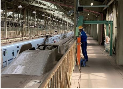
屋根上から車両を見学