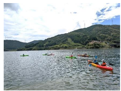
五ヶ山ダムでのカヤック体験