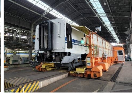
トラバーサ移動見学