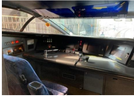
運転台見学（乗務員室）