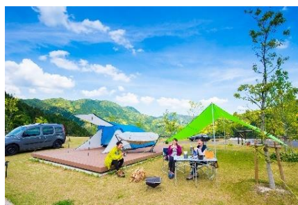
五ヶ山クロスキャンプサイト