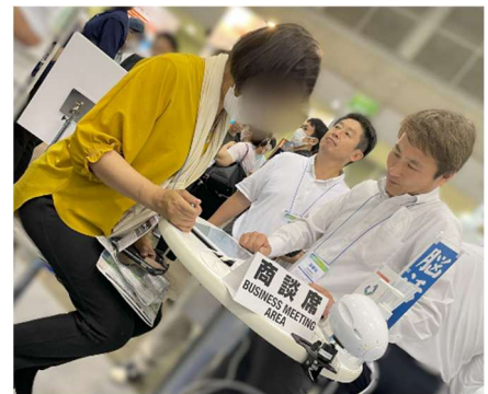
自治体・公共 Week2023 当社展示ブースの様子