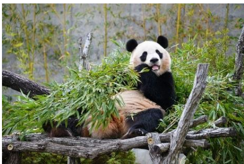
▲アドベンチャーワールド