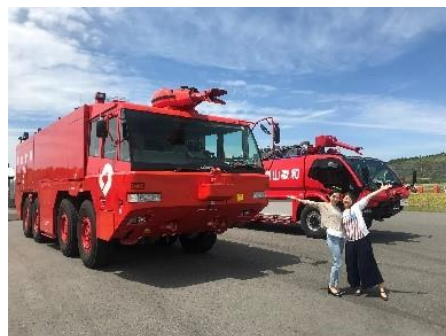
▲南紀白浜空港バックヤードツアー