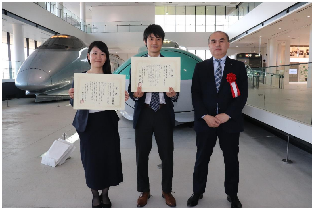
鉄道旅への想い溢れるグランプリ受賞のツアーを企画したおとなび・ジバング商品部のメンバー

鉄道 150 年の旅のストーリーをご体感いただけるツアーを企画しました。一生に一度の特別な鉄道の旅を演出したいという想いが『グランプリ』および『エスコート部門賞』の受賞につながりました。