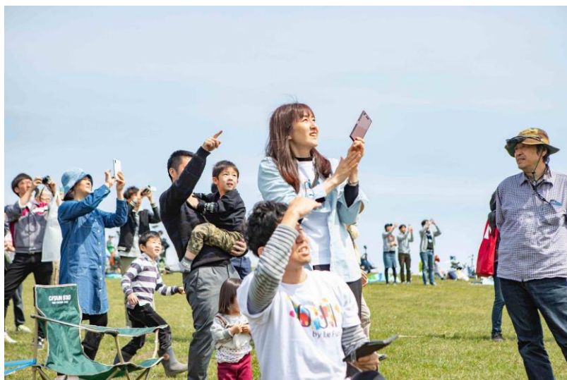
民間ロケット打ち上げ見学イベントの様子

また、航空宇宙のコンテンツと、北海道十勝の大樹町がもともと持ちあわせている食や農業、大自然などの地域資源を組み合わせ、地域ならではのユニークな観光価値を創出し、町内外の多様な事業者との連携を図り、北海道、十勝、大樹町の観光振興に貢献したいと考えています。