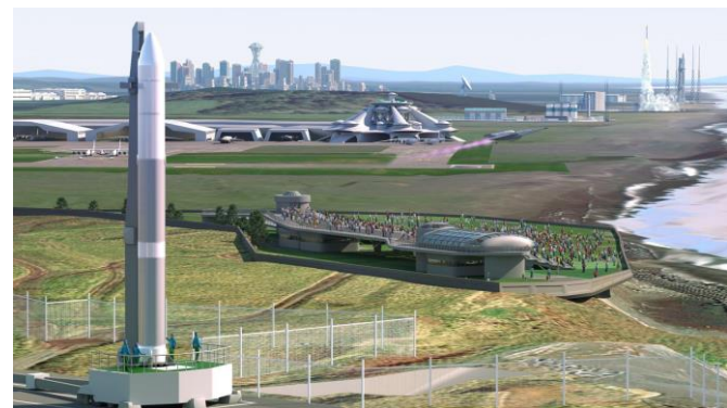
北海道スペースポート 将来イメージ図

HOSPOは世界の宇宙ビジネスを支えるインフラとして、航空宇宙の研究開発、ビジネスサポート、地方創生事業を含むビジネス機会を提供します。2025年までに2つの人工衛星用のロケット発射場整備を進めており、資金確保にはふるさと納税（企業版・個人版）および寄附の仕組みを活用しています。