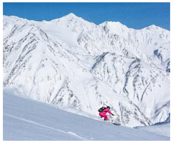
白馬八方尾根スキー場