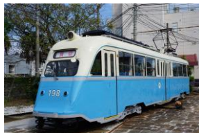
とさでん交通 外国電車(イメージ)