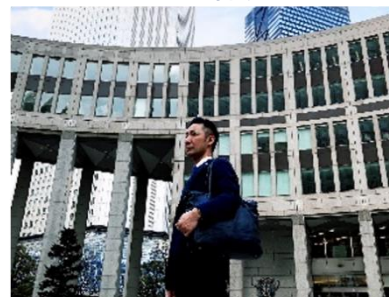
出張サポートにて