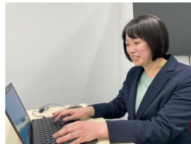
オンラインにて店頭スタッフ