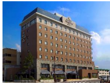
ホテルハーベストイン米子

(3) 宿泊箇所は扇形車庫を一望できるホテルハーベストイン米子の上層階をご用意。昼間は中で、夜はホテルからと扇形車庫を 2 倍楽しめるようご用意をしています。