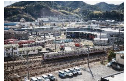
部屋からの眺望 (イメージ)

(4) 参加特典として、鉄道に関するお土産をプレゼントいたします。 ※プランによって内容は異なります。