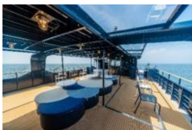
2階オープンデッキ「スピカテラス」