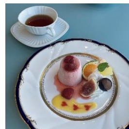
シェフオリジナルデザート（イメージ）