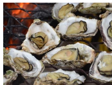
マルシェ（焼き牡蠣）