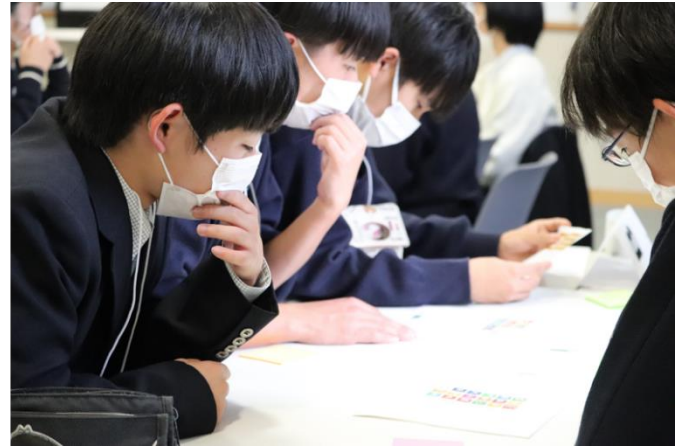
▼2021年11月7日 西日本大会（大阪）の様子