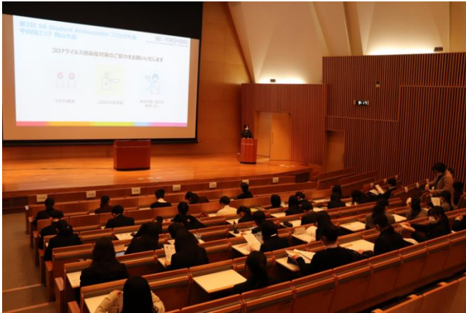
▼2021年11月6日 中四国大会（岡山）の様子