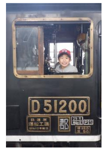
運転台撮影 イメージ