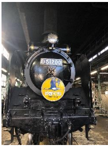
SL やまぐち号 イメージ